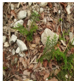
ヒノキの天然更新